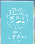
「サイクリングしまなみ」は、愛媛・広島両県で開催中の「瀬戸内しまのわ2014」のフィナーレを飾るイベントです。

エントリーに関するお問い合わせはこちらまで サイクリングしまなみエントリーセンター TEL:0570-031900 ■受付時間 10:00~17:00(土・日曜、祝日を除く) 大会に関するお問い合わせはこちらまで 瀬戸内しまなみ海道・国際サイクリング大会実行委員会 今治現地本部 TEL:0898-31-3190 ■受付時間:9:00~17:00(土・日曜、祝日を除く) 大会公式ホームページ http://cycling-shimanami.jp